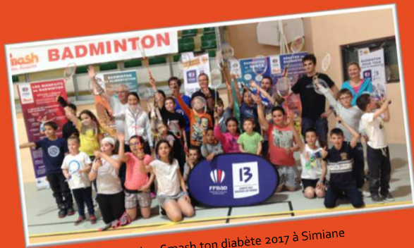
Opération Smash ton diabète 2017 à Simiane