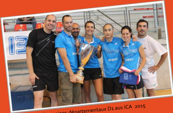
Champions départementaux D1 aux ICA 2015