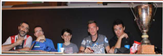
Phases finales de l'ICA 2016