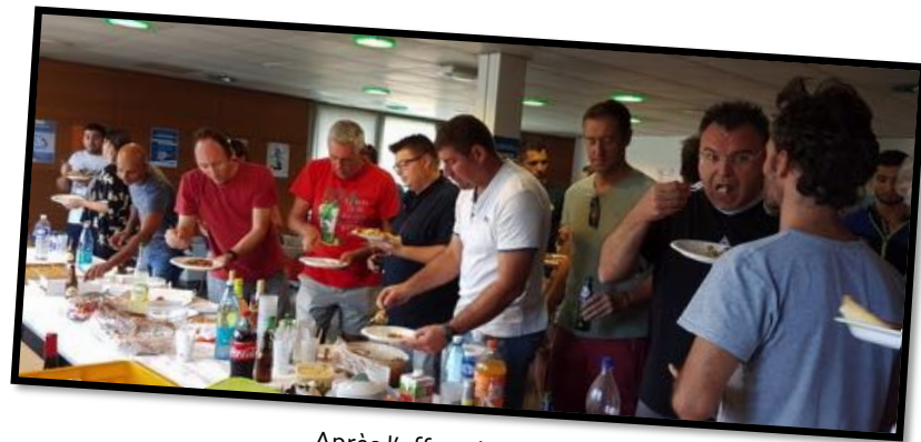
Après l'effort, le réconfort !