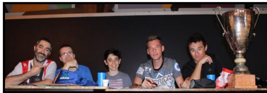
Finale des interclubs adultes à Sausset